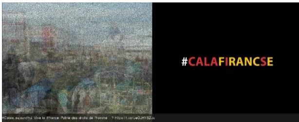
terrains vagues mirror by Yukao Nagemi

Video 32' & Digital prints (dimensions variable), (c) all rights reserved, 2016